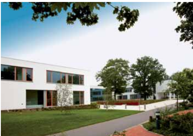
Berufliches Schulzentrum für Technik und Wirtschaft, BSZ Dresden

Das berufliche Schulzentrum für Technik und Wirtschaft in Dresden wurde von der Landeshauptstadt nach Plänen des Architekturbüros Rieger im Jahr 2007 energetisch saniert. Die Räume der Schule werden nun energiesparend von 90 TROX SCHOOLAIR-H belüftet.