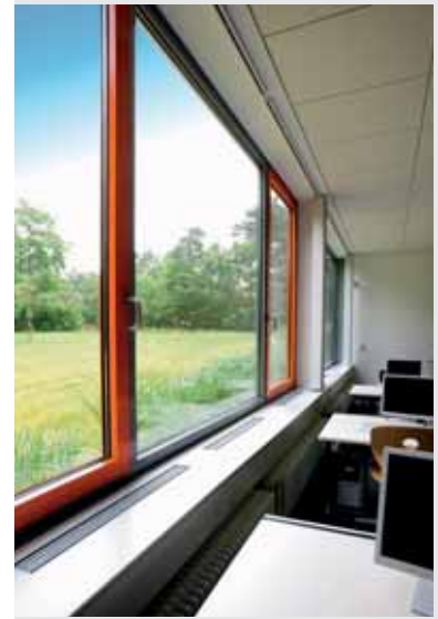
Berufliches Schulzentrum für Technik und Wirtschaft, BSZ Dresden

Eine Ansteuerung der Geräte kann auf Basis des CO 2 -Gehaltes der Raum- bzw. Abluft erfolgen, so dass kontinuierlich eine hohe Luftqualität gewährleistet ist. Alternativ kann man einfach und effizient mit festen Volumenströmen pro Betriebsart (Unterricht/Pause/Abwesenheit) arbeiten.