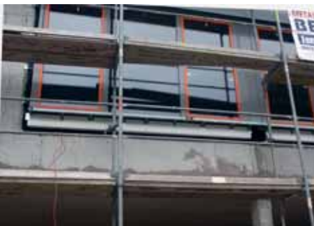
Die Sanierung von Fassaden öffentlicher Gebäude mit Wärmedämmung steht ganz oben auf der Prioritätenliste der Kommunen.