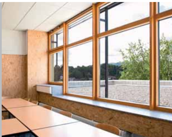
Kaufmännische Schule Hechingen mit 1.150 Schülern

2008 und 2009 wurden zur energetischen Sanierung 50 SCHOOLAIR-H eingebaut. Jetzt wird jeder Klassenraum individuell belüftet und viele Klassenräume werden komplett bedarfsgerecht geregelt.